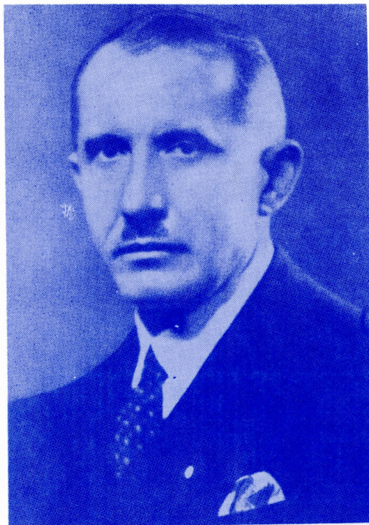
ПОЛКОВНИК ЄВГЕН КОНОВАЛЕЦЬ Основоположник УВО - ОУН

“У вогні перетворюється залізо в сталь У боротьбі перетворюється народ у націю” Євген Коновалець